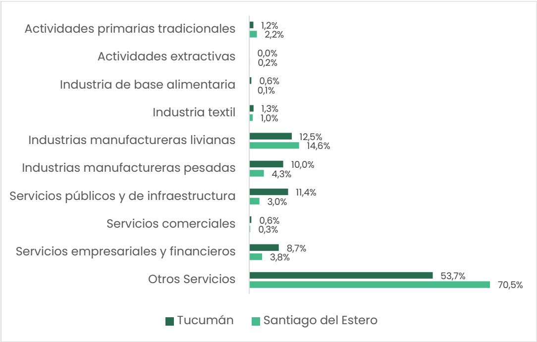
Figura 4 | Participación sectorial de Tucumán y Santiago del Estero (VAB)