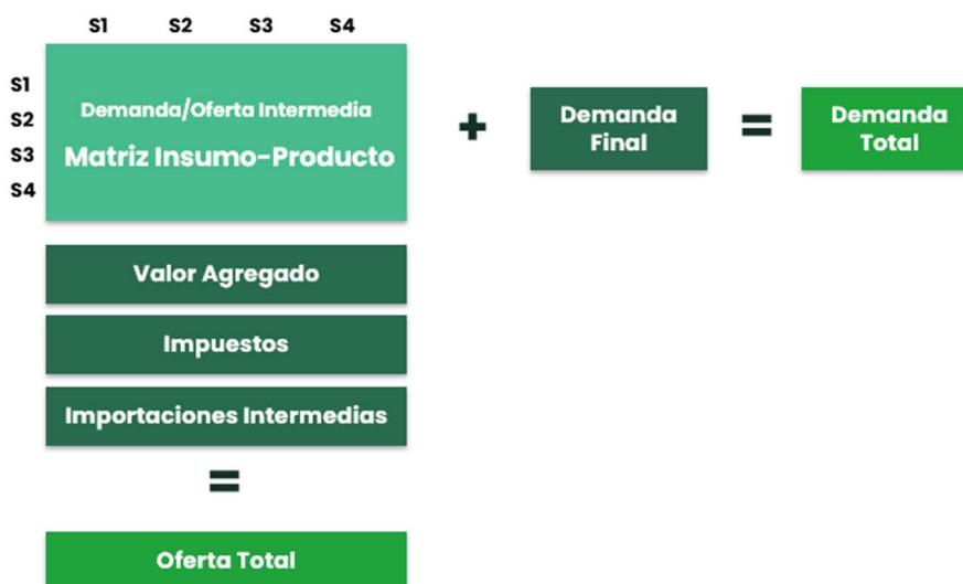
Figura 2 | Representación esquemática de la matriz regional cerrada.